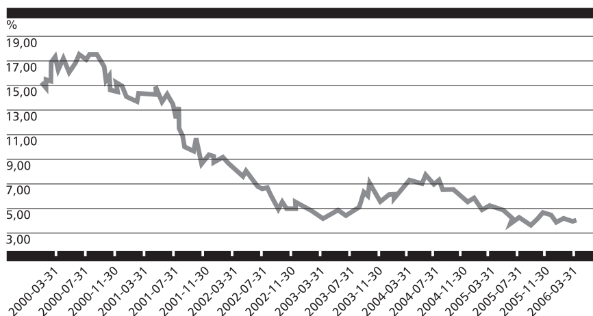
RENTOWNOŚĆ 3-LETNICH OBLIGACJI SKARBOWYCH

* dane na podstawie informacji publikowanych w serwisie Bloomberg